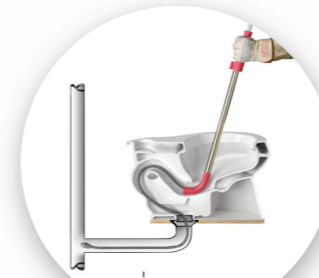
A. เครื่องท่ลงท่ สำหรับโถส้วม

1. เครื่องท่ลงท่ที่เราเลือกเครื่องท่ลงท่อันดับ 1 ของโลกยี่ห้อ RIDGID จากประเทศสหรัฐอเมริกา เพราะมั่นใจในคุณภาพแก้ปัญหาได้จบ