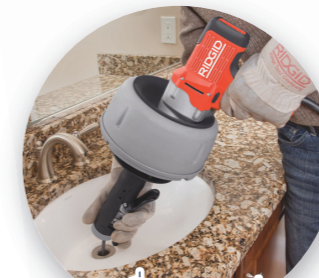
B. เครื่องท่ลงท่ สำหรับอ่างน้ำ