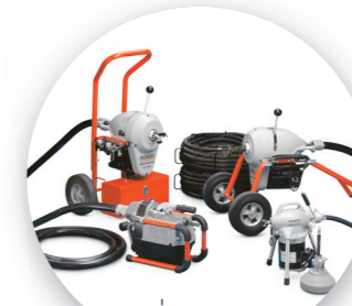
C. เครื่องท่ลงท่ แบบสายเคเบิล