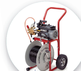
D. เครื่องท่ลงท่ แบบแรงดันน้ำ

2. กล้องสำรวจในแนวท่อ เพื่อทราบถึงต้นเหตุของปัญหา และ มั่นใจว่าปัญหาดังกล่าวได้ถูกแก้ไขไปเรียบร้อยแล้ว